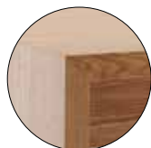
auf Gehrung verleimt