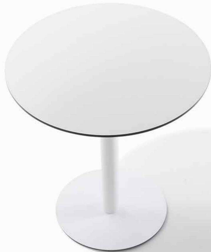
weiße HPL-Vollkernplatte | Gestell weiß pulverbeschichtet white HPL solid core panel | white powder-coated frame