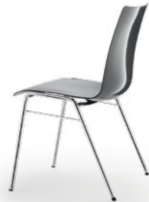
Schiefergrau slate grey

Ungepolstert · not upholstered Sitzpolster · seat upholstered