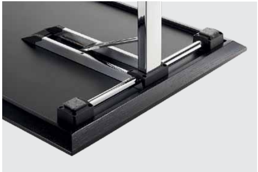
Klappbeschlag mit automatisch hochfahrendem Stapelklotz hinge element with automatically upwards moving bearing block