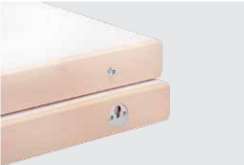
Verbindung Einhängeplatten connection of intermediate table tops